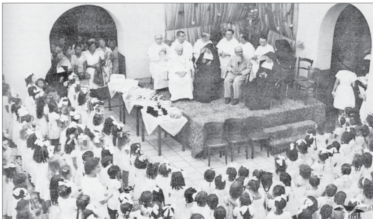
Het St. Martinusgesticht was na 1915 voor veel meisjes een voorbereiding op een maatschappelijk beroep.

In 1884 kwam er een nieuwe onderwijsverordening tot stand die de kwaliteit van het openbaar onderwijs wilde verhogen. Kinderen van welgestelde ouders die schoolgeld betaalden, konden voortaan op een burgerschool een muldiploma of getuigschrift behalen. Meisjes en jongens op dit niveau kregen de kans 'Normaallessen' te volgen om onderwijzer(es) te worden. In de eerste tien jaar na de verordening haalde de koloniale overheid het personeel voor de drie openbare scholen vooral uit Nederland, maar langzamer-